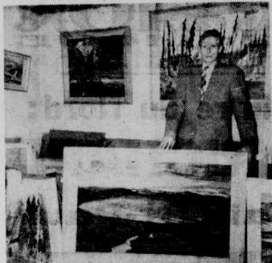
● LE PEINTRE DU NORD, au milieu de ses œuvres préférées : en bas, le cratère de l'Ungava; en haut, ô gauche, une tourmente du Nord; à droite une riente tuation.