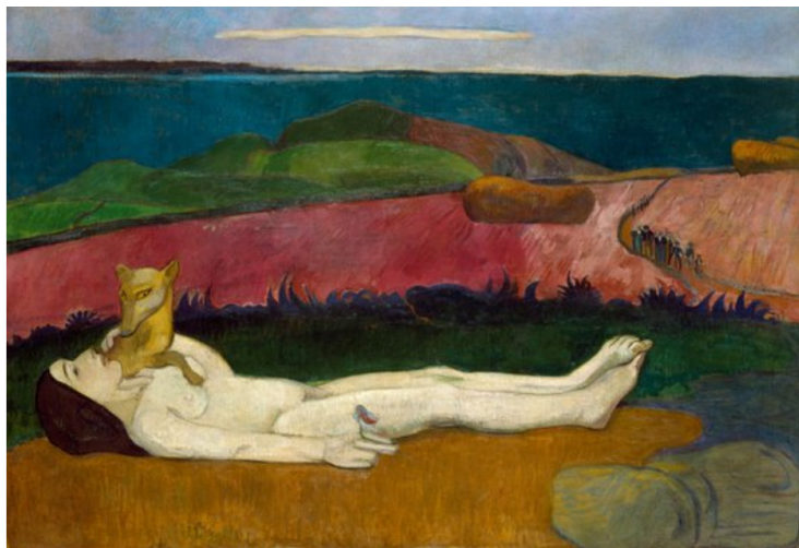
Paul Gauguin La perte du pucelage 1890-91