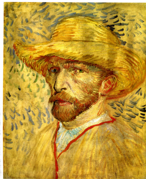
Vincent Van Gogh Autoportrait 1887

L'estampe japonaise, le vitrail, les émaux, les motifs des vases en porcelaine dérivés des manufactures orientales et les Images d'Epinal gravées sur bois au Moyen Age furent autant de sources à cette nouvelle simplification des moyens d'expression de la peinture. Cela impliquait une idée bien partagée par les artistes du cercle de van Gogh que les formes d'art naïf ou primitif étaient un excellent modèle pour les artistes modernes parce que ce modèle les rapprochait des instincts fondamentaux de l'homme, instincts qui étaient fort éloignés de l'art artificiel des salons à la mode où les allégories mythologiques et historiques complexes régnaient en maîtres dans le monde de la peinture.