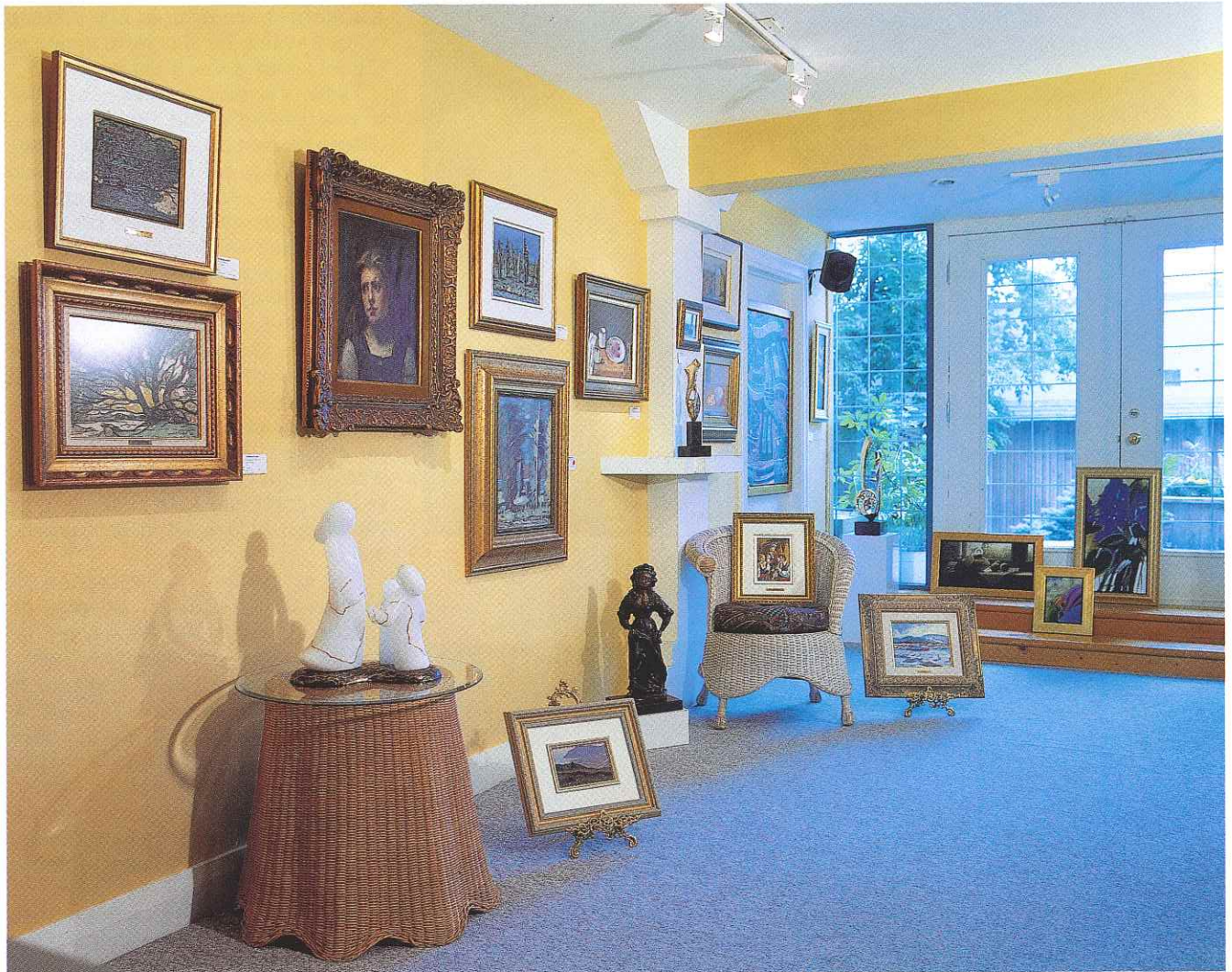
Vus des différents salons qui attendent les amateurs d'art.