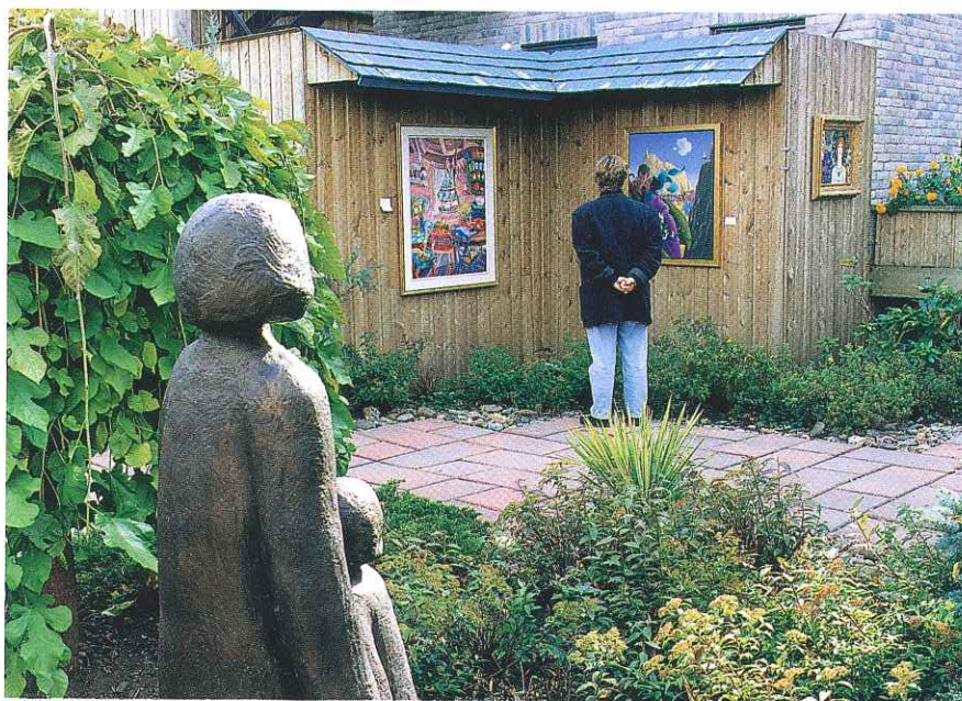
Vues des jardins où les visiteurs peuvent durant la belle saison voir les tableaux des peintres de la galerie.

prennent fin, Bonnitta Beauchamp reviendra aux arts, en 1986, mais cette fois en y entrant par la grande porte: elle ouvre Le Balcon d'Art dans sa location actuelle, rue Notre-Dame, à Saint-Lambert.