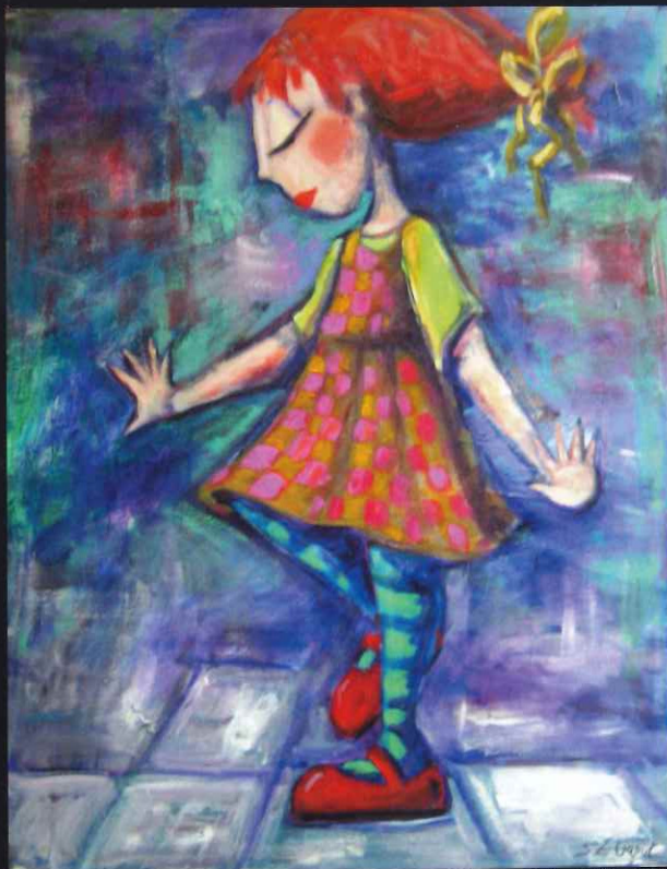
Hopscotch, 30" x 24"