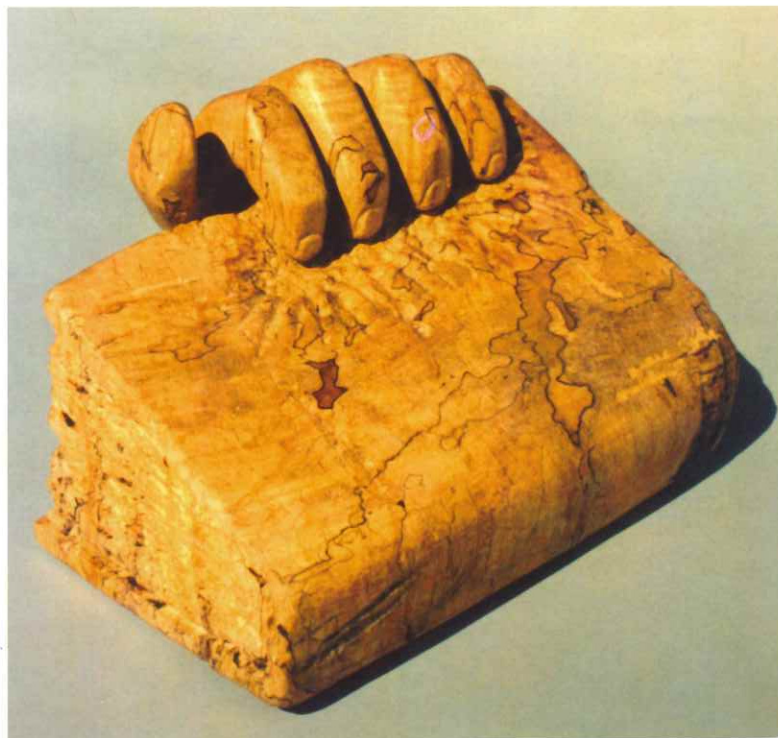
« Livre égratigné par la critique »

La collection d'œuvres de Stanké est importante, en fait il en possède plus de 250. Et, comme mentionné ci-avant, elles traitent majoritairement de livres mais d'une façon humoristique et sont de tailles variées. Alors qu'il était éditeur, il avait même dans son bureau une table vitrée qui reposait sur d'immenses bouquins qu'il avait sculptés dans le bois. Il a d'ailleurs signé quelques unes de ces tables absolument uniques et originales. Le thème de la sexualité est fort présent dans ses œuvres et est aussi abordé d'une façon amusante. Rien pour choquer ou pour agresser, simplement un clin d'œil sur cette force de la nature qui gouverne le monde. Sa pro-