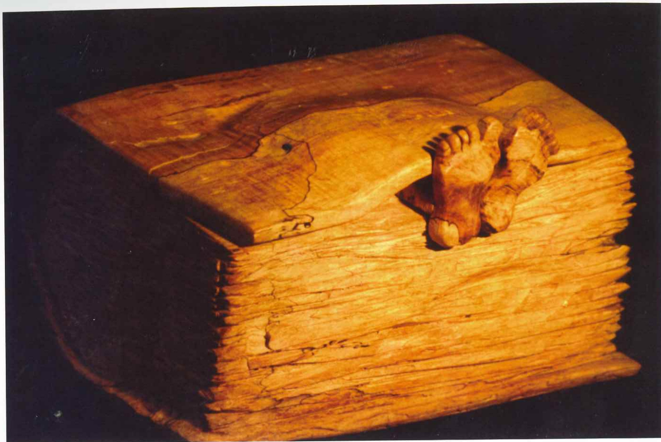
« Le livre dort »