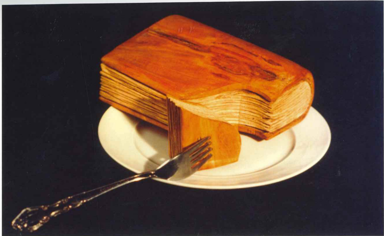
EATING BOOKS, FEEDS THE BRAIN/Manger du livre, nourrit l'esprit