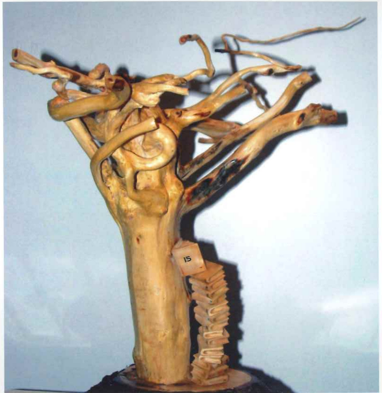
FIFTEEN YEARS/Quinze ans, Rencontre des arts

WESTMOUNT GALLERY IS PROUD TO ANNOUNCE OVER 31 YEARS IN BUSINESS