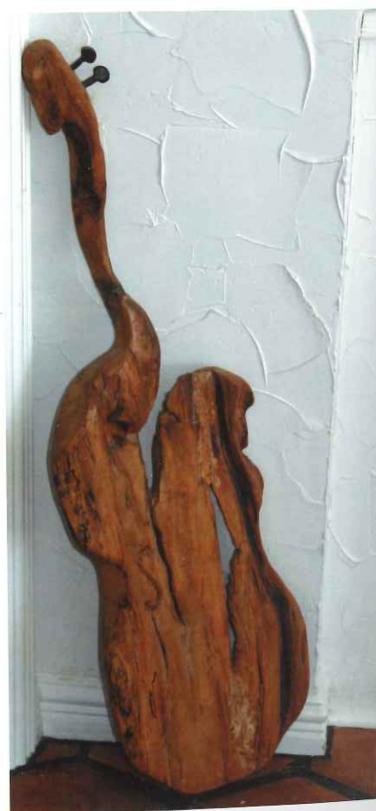
« C'est le luth final »