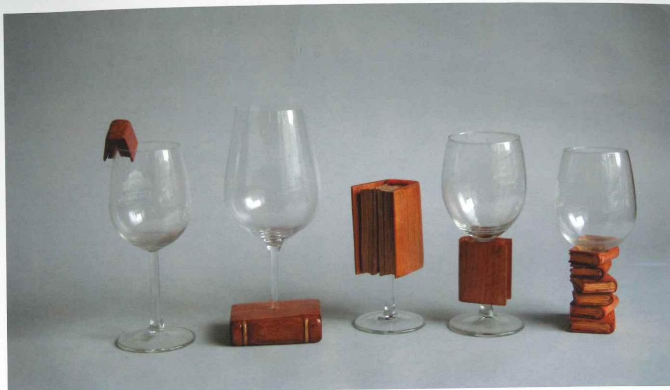
« Les joies du livre »

duction est tout de même diversifiée; les chats, les personnages, les villes, le vin, sont autant de thèmes forts différents qui l'inspirent. Certaines de ses pièces ont été moulées et coulées dans le bronze, plus d'une dizaine en fait. Ce sont toutes des pièces uniques dont plusieurs se retrouvent chez des collectionneurs. Parmi ceux-ci, certains sont des inconditionnels de Stanké et possèdent un grand nombre de ses créations.