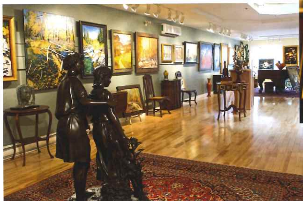
Invitante et chaleureuse pièce où tableau, sculptures côtoient un piano.