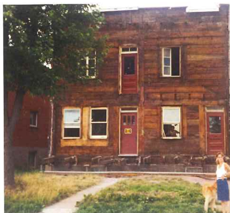
La façade qu'offrait la galerie en 1986, avant que commence les travaux majeurs d'installation.