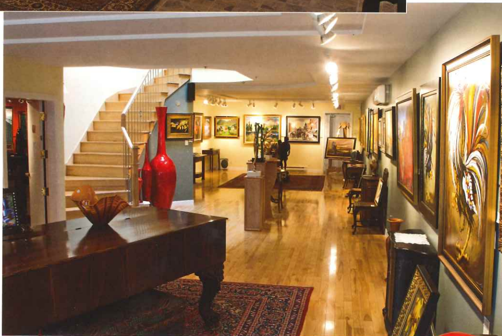
Une autre pièce vaste et invitante de la galerie.

clientèle amatrice d'art, elle en dresse un portrait élogieux : « Les personnes attirées par les arts ont généralement de bonnes valeurs et sont très sensibles. Apprendre à les connaître est un privilège. » Nombre d'anecdotes témoignent de la relation particulière entre l'art et les gens et du passeur entre les deux, le galeriste. « Une des plus grandes leçons apprises au cours des ans est de ne jamais juger quelqu'un sur son apparence. »