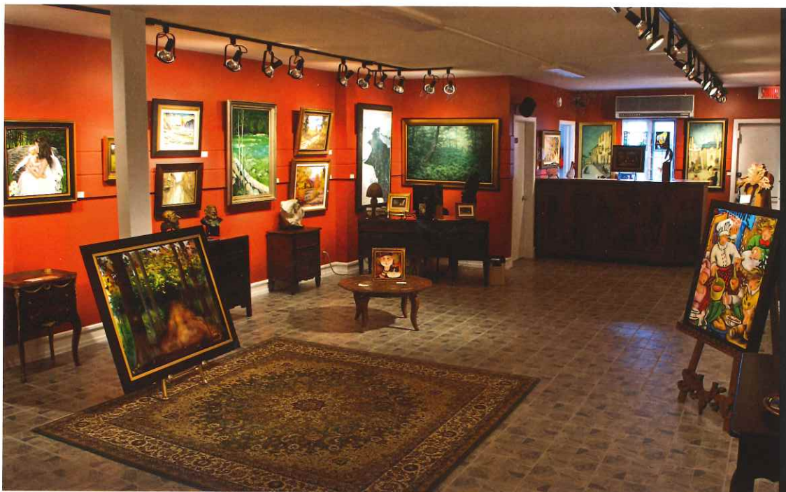
Décor classique et élégant où l'on présente aux visiteurs tableaux et sculptures.