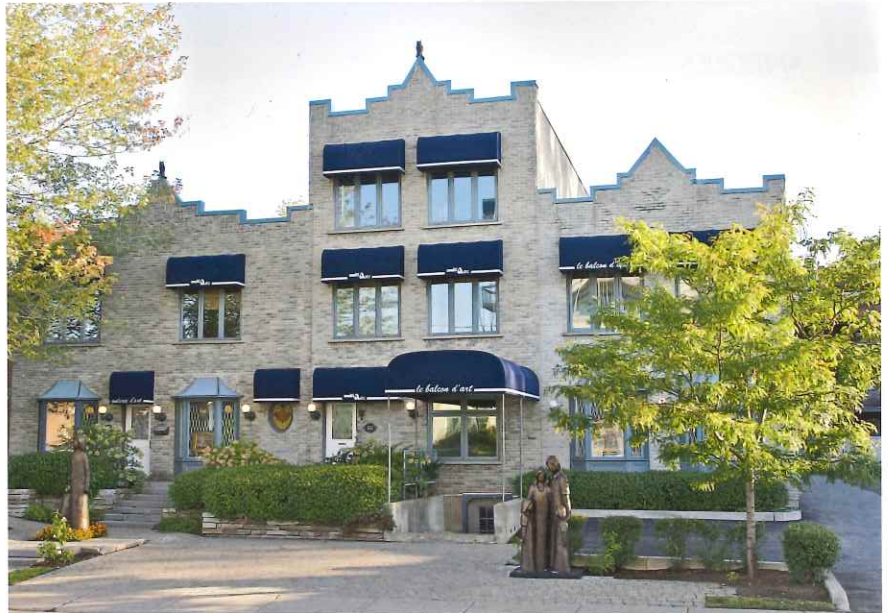
The inviting exterior of the gallery.