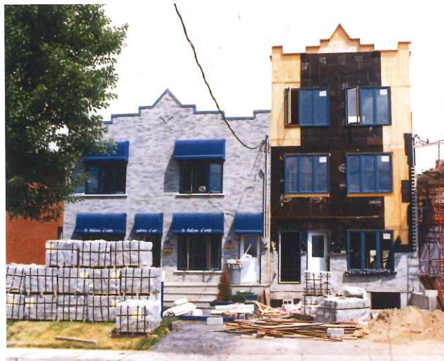
Le premier agrandissement.