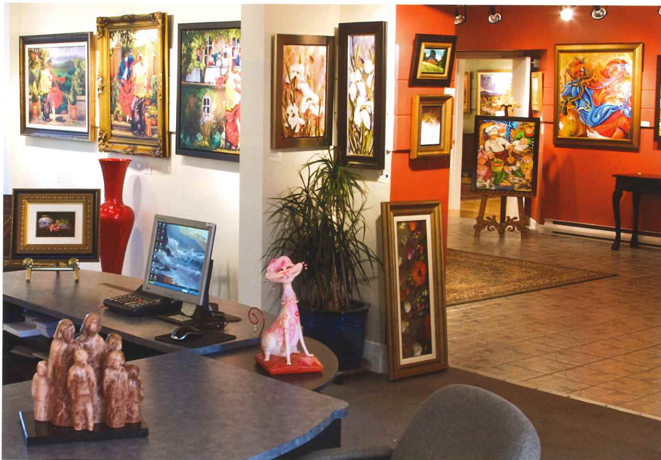
The elegant interior.