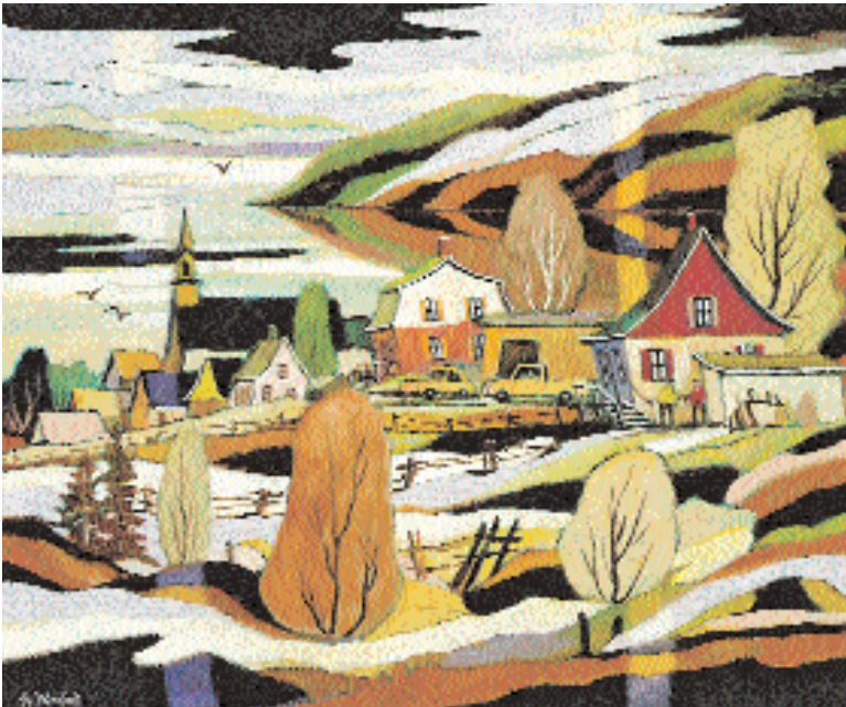
« A flanc du fleuve », 2006, 30 x 36 po.

blancheur du support qui l'amèneront plus loin que ce qu'il avait imaginé.