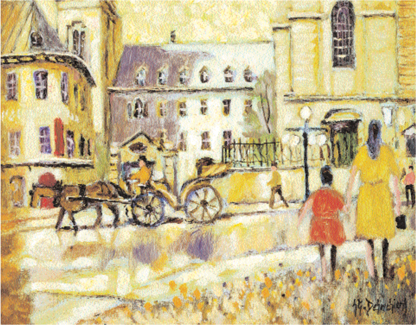
« Le petit séminaire », 2006, 11 x 14 po.