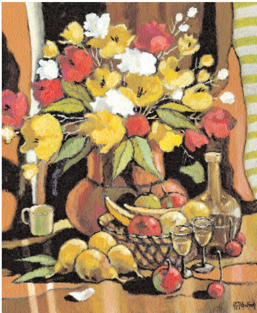
« Vin, pêches et fleurs », 2006, 36 x 30 po.

Monsieur Jean-Guy Desrosiers sera l'artiste honoré dans le cadre de la 18 e édition du Festival de Peinture à Mascouche, les 7, 8 et 9 octobre prochain. Un autre honneur bien mérité pour cet artiste à la belle et longue carrière.