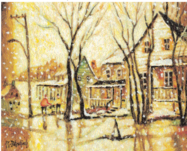
« Au bout de l'île », 2006, 11 x 14 po.

rence à la réalité pour structurer le tout. Un réflexe venu par l'exercice de son métier d'illustrateur scientifique au Centre de Recherche de Valcartier.