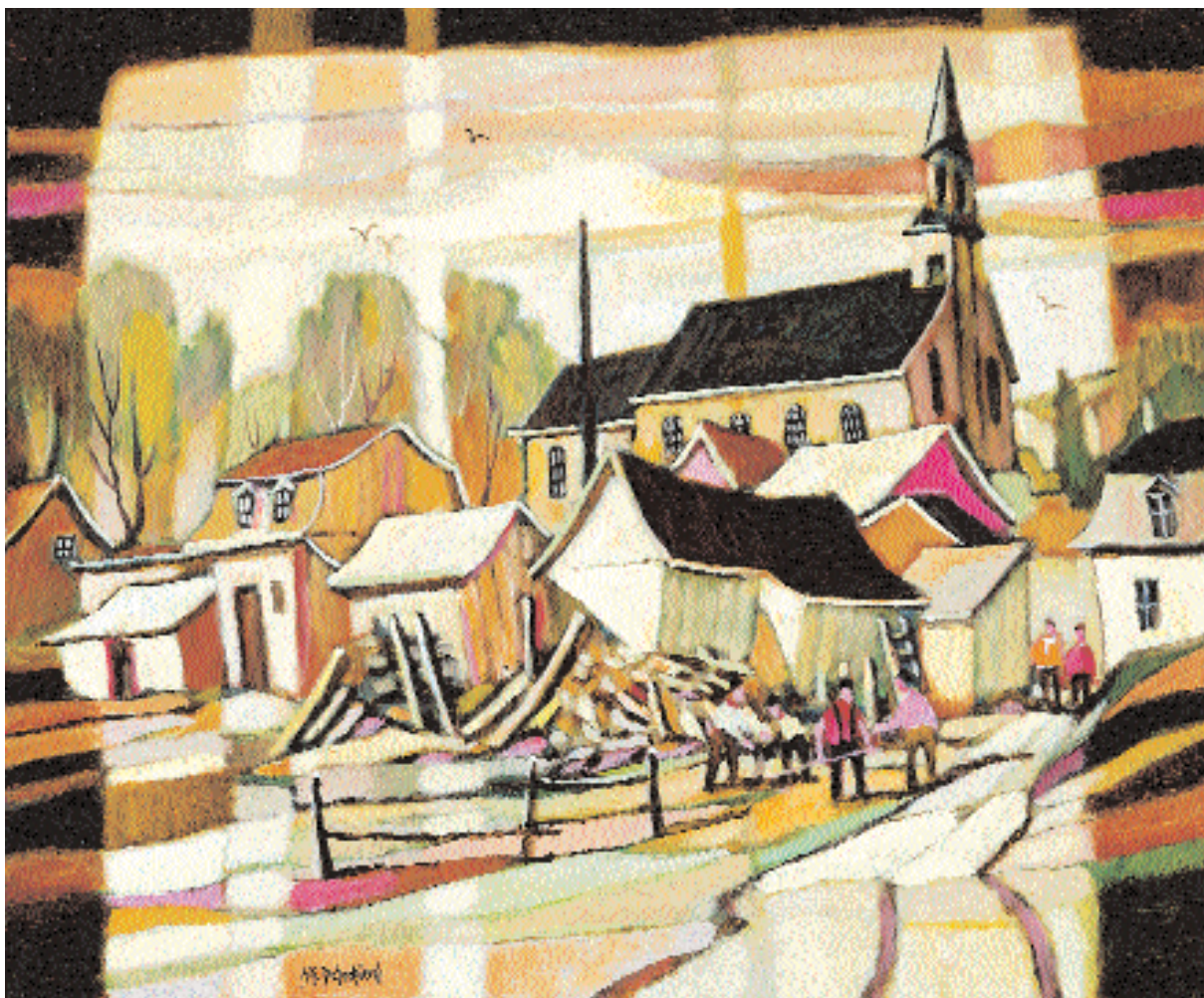
« Printemps à St-Hilarion », 2006, 20 x 24 po.

L a chaleur de sentiment, le plaisir d'amener à voir plus loin que ce qui est montré et le bonheur inscrit dans les paysages, les marines et les natures mortes, sont des constantes de Jean-Guy Desrosiers. Mais elles disent aussi que le peintre, pour récuser les moments susceptibles d'accueillir la morosité du convenu, cerne de près l'expressivité enlevée de ses toiles, se plaisant alors dans les rythmes actifs et alternés des lignes, des formes et des couleurs comme suspendues