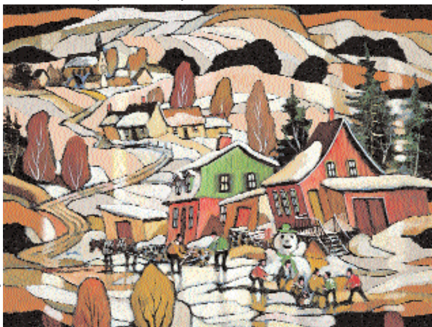
« Quand l'hiver se fait jeux », 2006, 30 x 36 po.