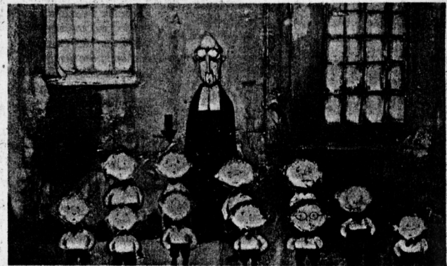
«Souvenir de la petite école et le chouchou».