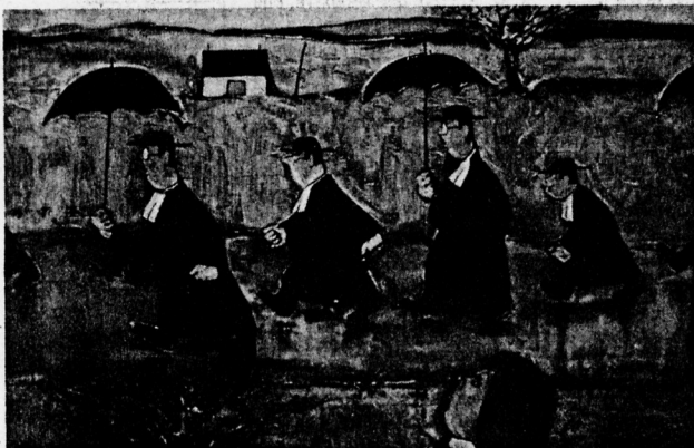
«Deux anciens juges et quatre anciens avocats qui ont changé de robe».