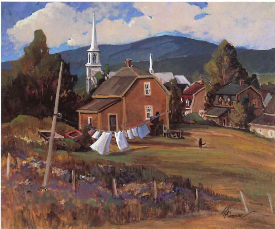
S-PAUL-DE-MONTMIGNY, 20 x 24 in.

Her older brother Tex rapidly developed into a painter and in his turn taught Louise what he knew, showing her how to look, and more importantly, how to see. Tex mastered painting early on and Louise found it difficult to con-