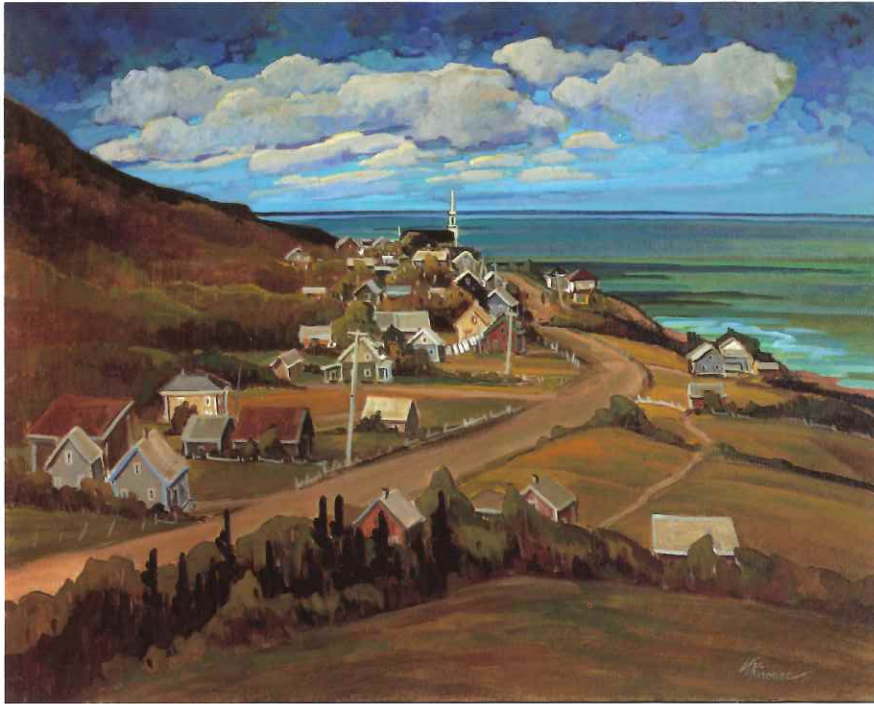
« St-Joachim de Tourelle », 24 x 30 po.