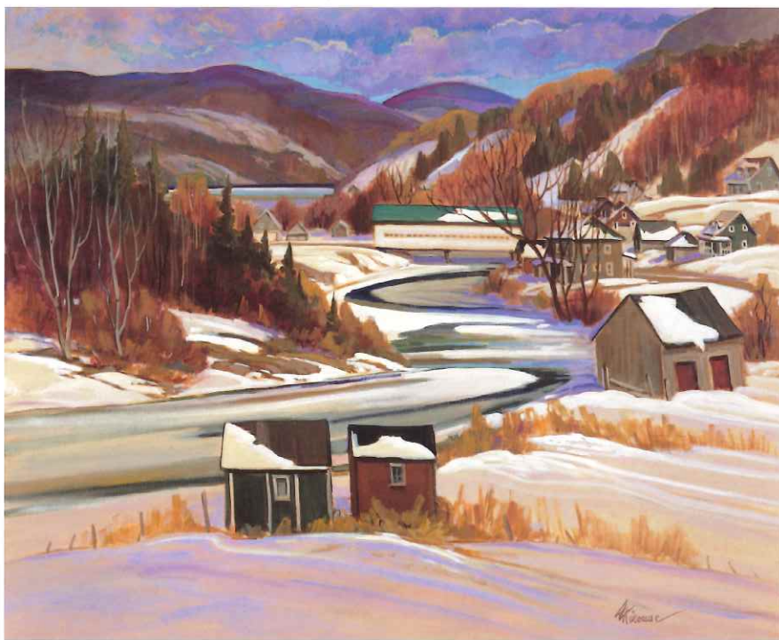
« Pont couvert, Anse St-Jean », 30 x 36 po.

Pour manifester avec force les sensations dont elle s'imprègne sur place, elle affectionne les formats de bonnes dimensions (souvent 24 x 30 ou 30 x 36 po.), lesquels véhiculent mieux cette impression de grandeur qui émane des vastes étendues et des larges panoramas. À l'image de celle qui leur donne vie, ses œuvres produisent un impact à la fois doux et fort, partiellement par leur taille mais surtout par la puissance