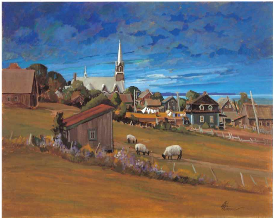
BAIE DES SABLES, GASPÉSIE, 24 x 30 in.

"Modern materials like vinyl siding or aluminium may be more practical but they hide the beauty of old houses. I understand that people want to do as little maintenance work as possible because they don't have the time to do it anymore but I prefer to paint them the way they used to be." This longing for the way things used to be explains why she will often insert cows or sheep into landscapes where they no longer