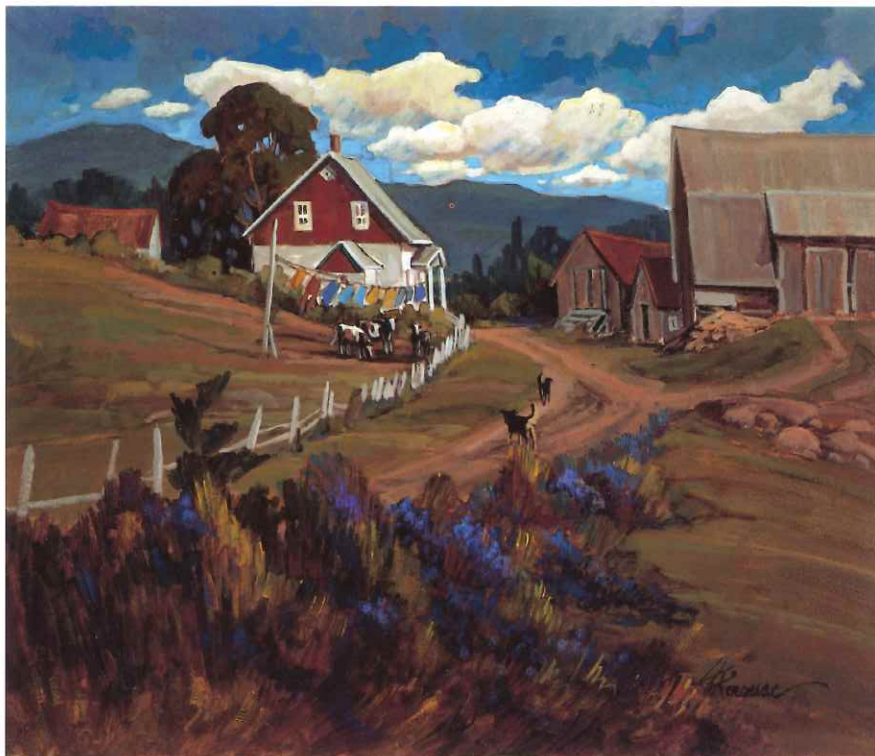
ST-CLÉMENT, BAS ST-LAURENT, 20 x 24 in.

exist. "You hardly see any animals grazing in the fields anymore thanks to the way they are now raised. I like to take them out of their barns in my paintings."