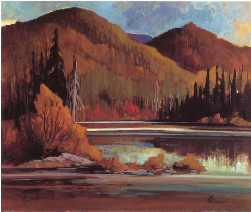
TRANQUILITÉ, PARC DU MONT-TREBLANT, 20 x 24 in.