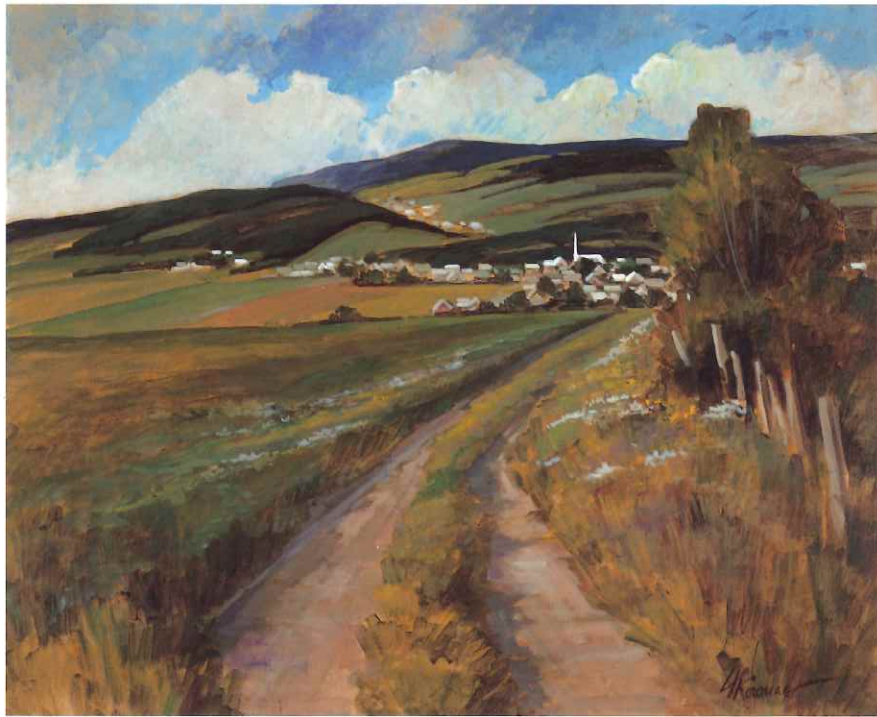
« St-Donat de Rimouski », 24 x 30 po.