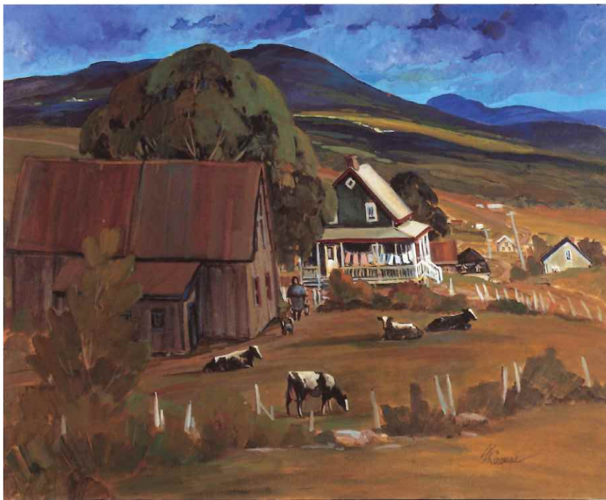
« En Charlevoix », 24 x 30 po.

jours, elle se souvient avoir dû, au départ, peindre sur la table de la cuisine parce qu'elle n'avait pas encore d'atelier. « À l'heure des repas, il me fallait ranger chaque fois mon matériel et tout ressortir après. » Comme quoi la véritable passion s'accommode d'un rien et prime sur l'inutile.