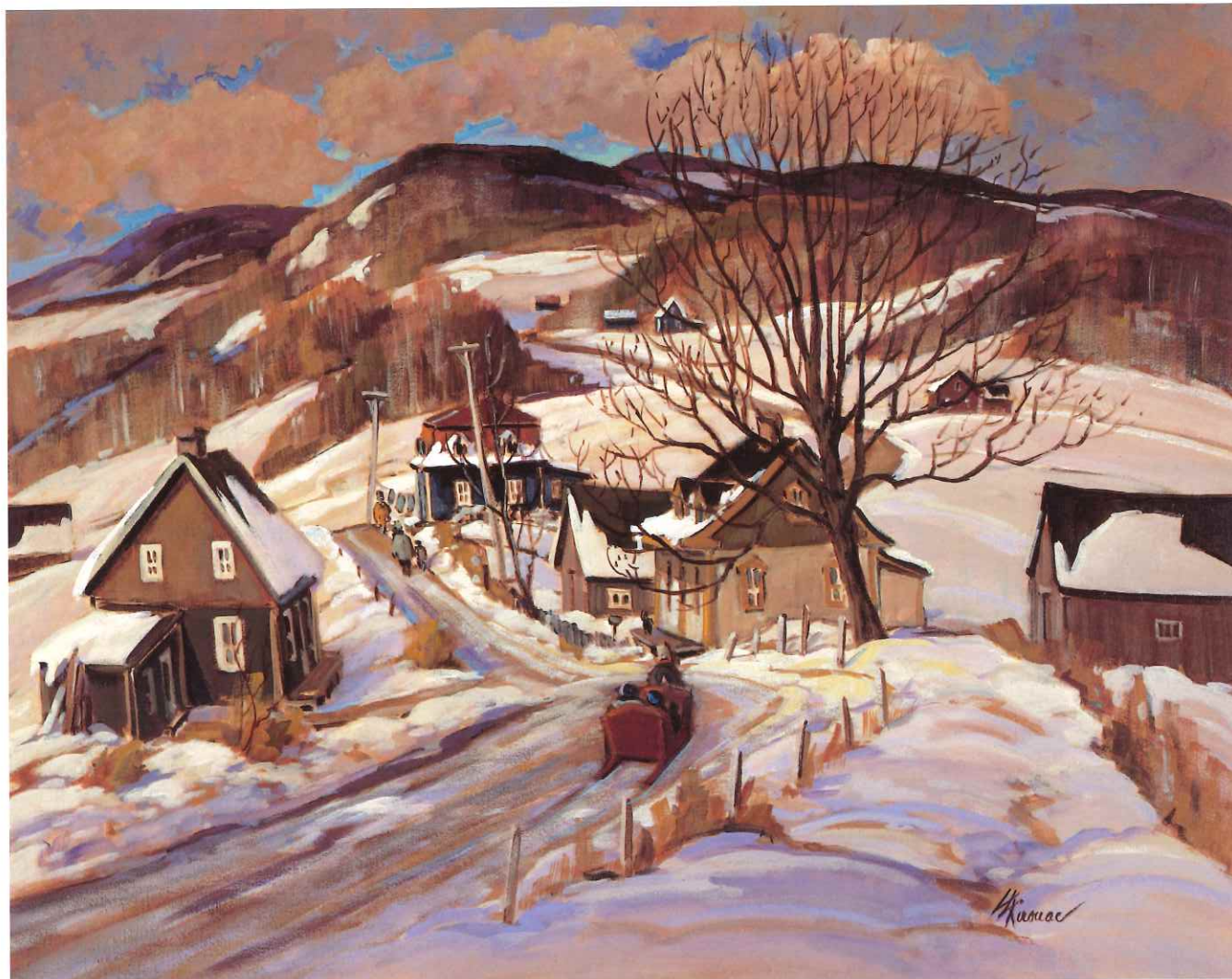
LA TOURNÉE, 24 x 30 in.