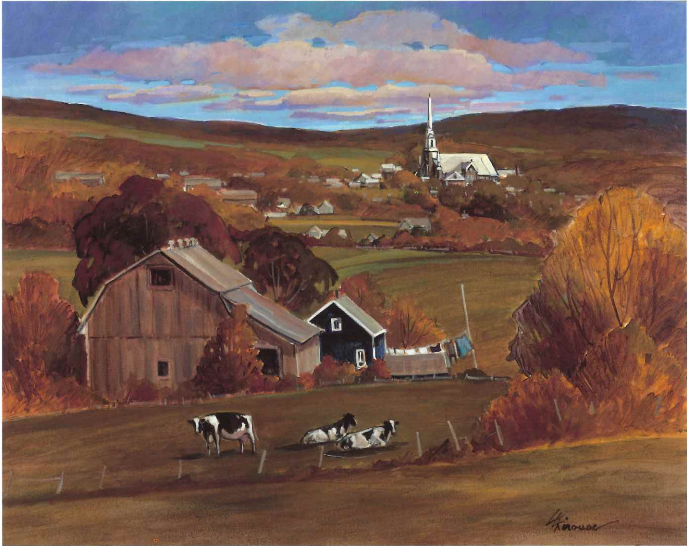
WARWICK, BOIS-FRANC, 24 x 30 in.

light and the right time of year to suit her subjects. This ability is supported by her ability to see nature through a state of grace.