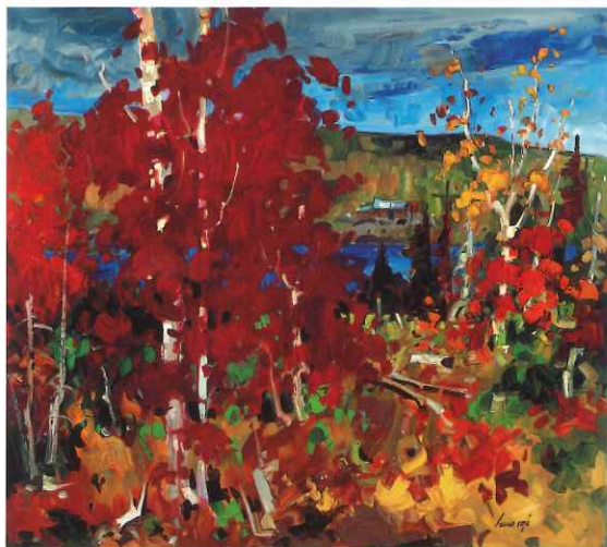
Octobre au camp, 36" x 40" Oil on panel / Huile sur masonite