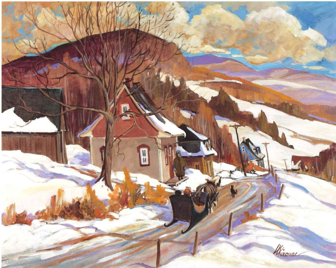
« La parenté est arrivée », 24 x 30 po.