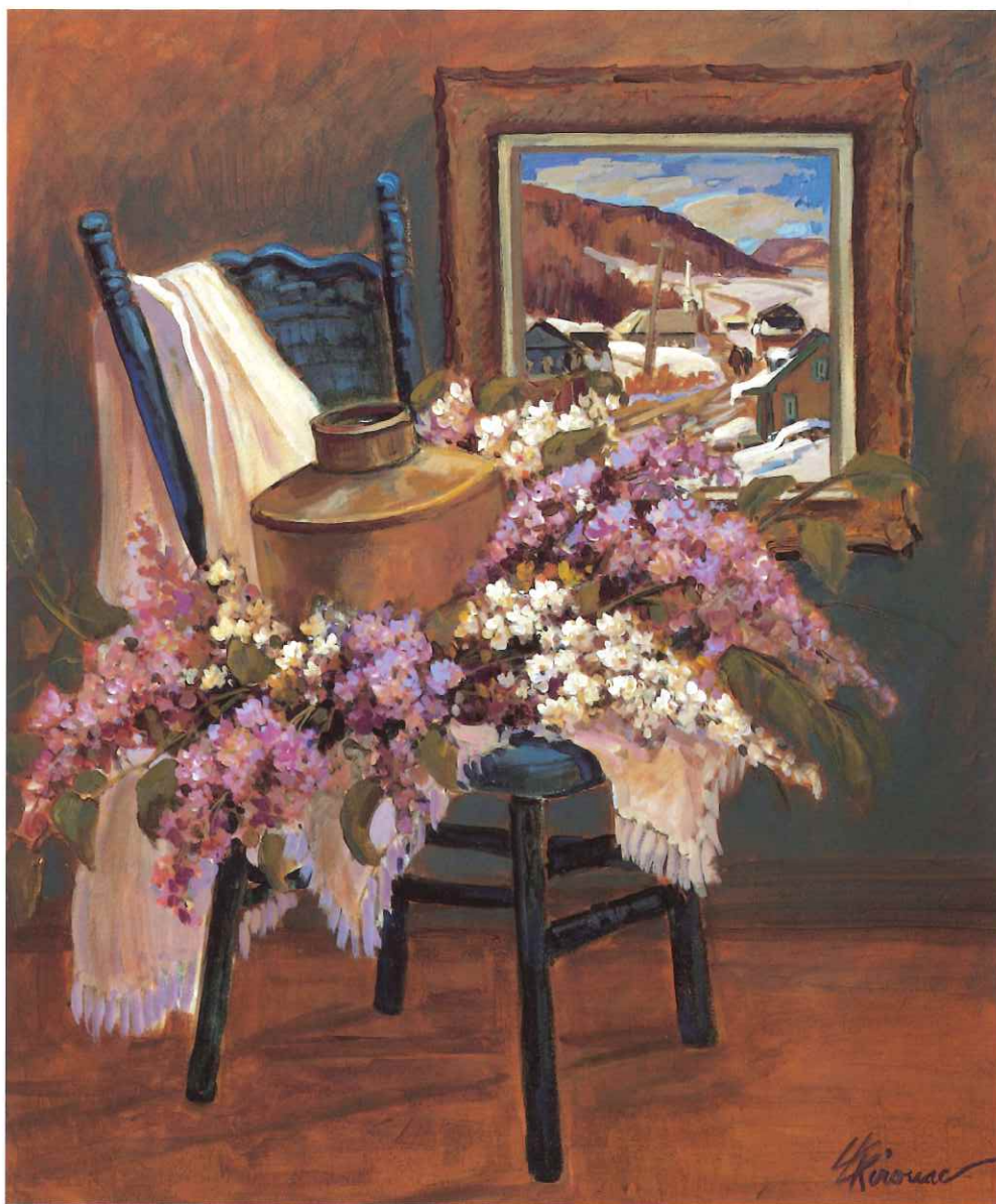
« Une belle cueillette », 24 x 20 po.