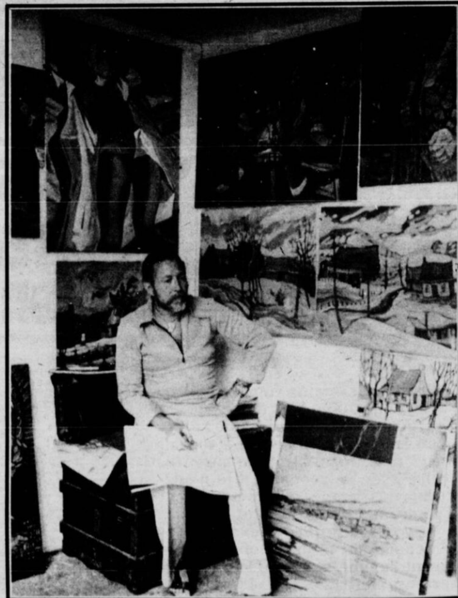
C'EST A SA VÉRITABLE VOCATION PREMIÈRE, LA PEINTURE, QUE TEX EST RETOURNE DEPUIS UN AN. Il adore peindre des scènes typiques de la vie québécoise comme on en voit ici dans son atelier.