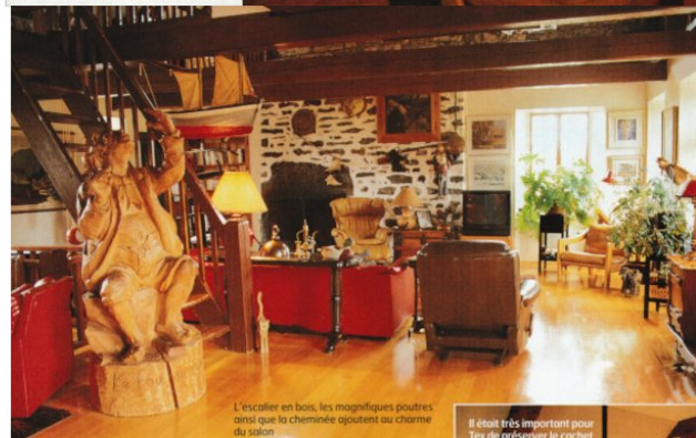
L'escalier en bois, les magnifiques poutres ainsi que la cheminée ajoutent au charme du salon