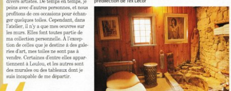
La salle de bain, d’une originalité peu commune, est l’oeuvre d’Anne-Marie, la fille de Tex