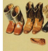
36 LE MAGAZINE 7 JOURS

“J’ai gardé toutes les bottes d’enfant de Saguy, mon fils. La première chose que je regarde chez un enfant, ce sont ses petits pieds. Je trouve fascinant de penser qu’un jour il ne pourra même plus mettre le gros orteil dans ses chaussures de bébé. La petite sandale, au centre, vient du Mexique; le modèle est toujours à la mode.”