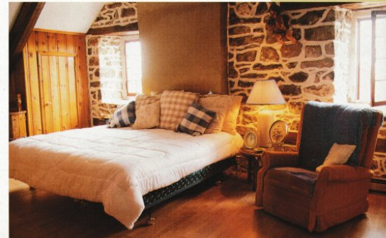
La peinture et le grand ménage de cette pièce viennent à peine d’être terminés. Les toiles n’ont pas encore retrouvé leur place sur les murs de la chambre à coucher.

“Il y a cinq ans, j’ai été reçu Fils de la Liberté. Ce titre a été décerné pour la première fois à un Patriote en 1837 et est maintenant décerné par la Fraternité des Fils de la Liberté aux personnes dont on reconnaît l’attachement au Québec. Depuis 1837-1838, une personne est ainsi honorée chaque année. Ces bottes et ce fusil sont authentiques. Ce sont des souliers “de boeuf”, expression qui désigne les bottes que portaient les Patriotes.”