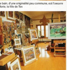
L’atelier où trônent les oeuvres du maître