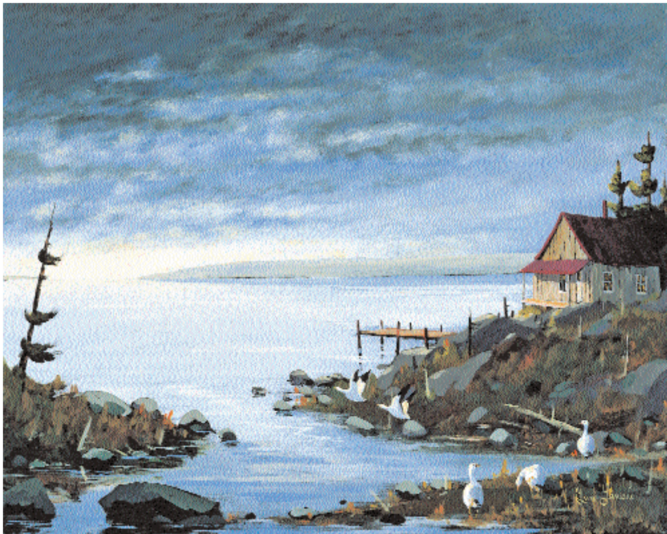
« Les oies sont arrivées », huile, 24 x 30 po.

d'expression qui à travers le souci du pittoresque des scènes champêtres, lui permet de traduire de manière fort personnelle, la réalité de ce Charlevoix qu'il aime tant.