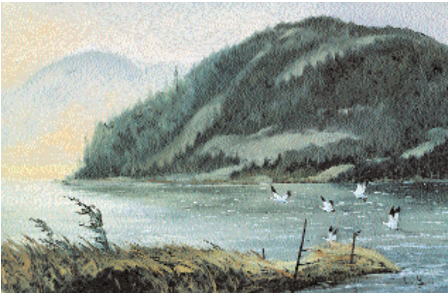
« Un coin caché de Baie-Saint-Paul », huile, 26 x 36 po.

pinceaux entraînent la mobilité du regard au moyen de larges traits et aplats venant procurer une véritable sensation de féerie; le noir du fond de la toile venant accentuer la présence lumineuse en maximisant la saturation des couleurs parfois pures. Dans certains tableaux, à première vue, les couleurs étalées frisent l'univers de l'abstraction, suggérant ainsi au spectateur différents angles d'une perception renouvelée. Or si le rythme des formes, le recours aux couleurs fauves, rugissantes et une certaine déformation contrôlée des perspectives sont bien présents au sein des tableaux, c'est surtout l'effet lumineux qui constitue vraisemblablement cette présence qui relève d'une volonté de véridicité tout en dégageant une part de poésie, et qui est la signature de l'artiste.