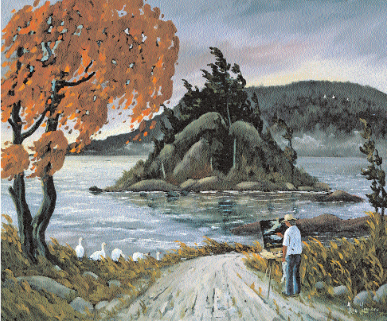
« Les spectateurs », huile, 30 x 36 po.