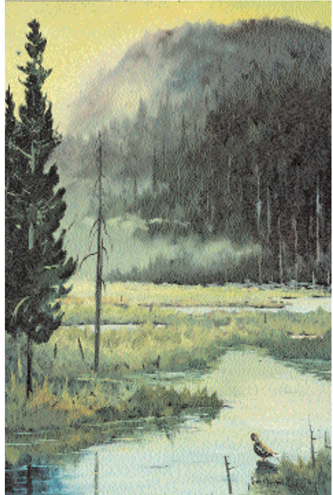
« Marais du Nord », huile, 36 x 24 po.