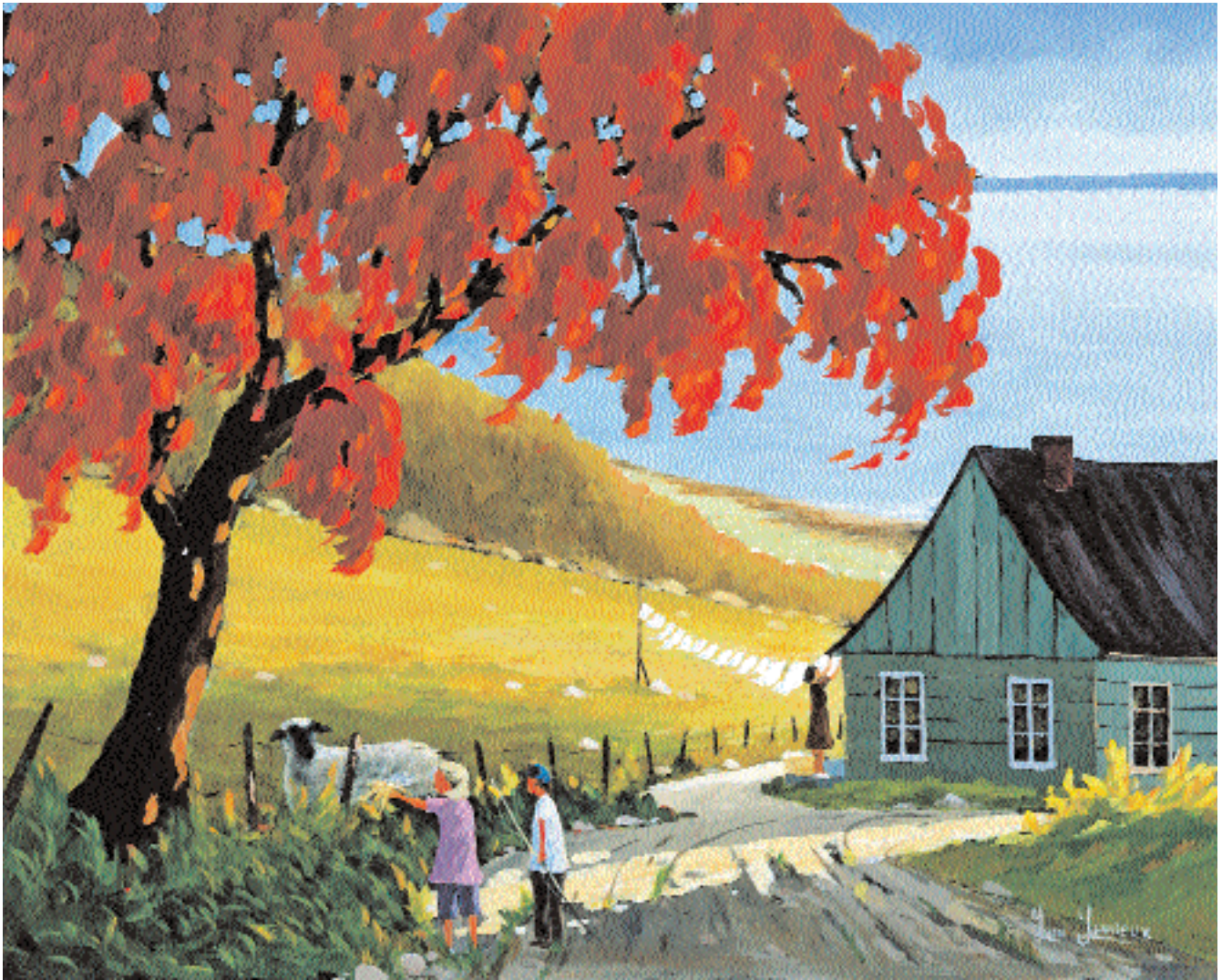
« L'approche », huile, 24 x 30 po.

Q ue représente la présence de l'arbre au feuillage incandescent ? Que symbolise cette lumière douce et enveloppante venant l'apaiser. Ces questions semblent au cœur de l'art d'Yvon Lemieux pour qui, la peinture est d'abord « jeu de l'esprit ». Or, s'il est