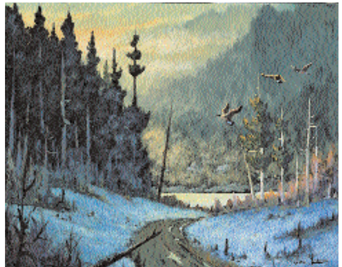
« Sur la Jacques-Cartier », huile, 24 x 30 po.