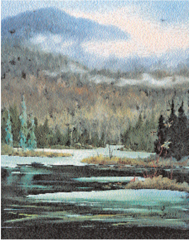
« De la grande visite aux marais », huile, 24 x 20 po.

Ces jours-ci, l'artiste jubile. Amoureux fou des toiles de Clarence Gagnon et de Marc-Aurèle Fortin, ses deux pôles d'inspiration, voici qu'il exposera à titre d'invité pour un événement particulier au Musée national des beaux-arts du Québec dans le cadre de l'exposition Clarence-Gagnon.