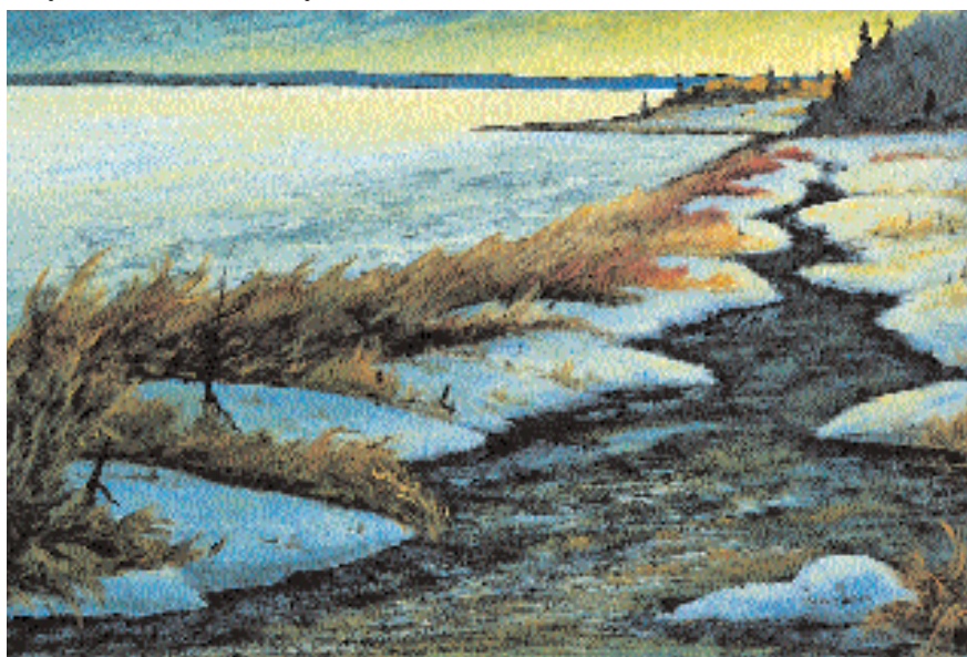
« Cap-aux-Oies », huile, 24 x 36 po.

Dans ses œuvres récentes, l'artiste renforce cette tendance. Les coups de