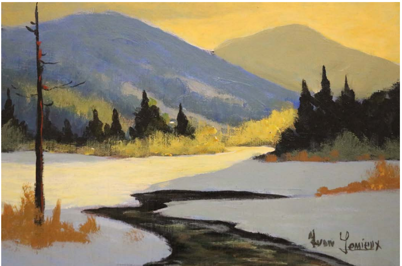
Journée froide , Oil on Board, 5 x 7 in