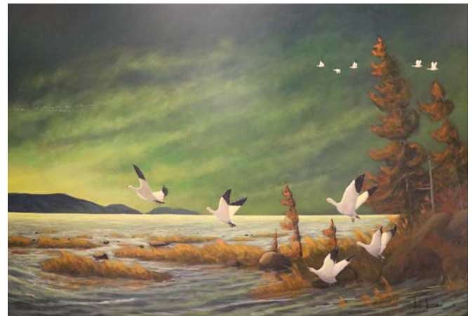
L'envol, huile sur toile, 48 x 72 po