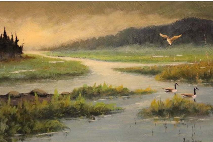
Marais du nord, huile sur panneau, 24 x 36 po

Né dans la petite paroisse de Saint-Pascal à Québec, Yvon Lemieux a commencé à peindre à l'âge de 16 ans; il peint maintenant depuis 50 ans. Comme le temps passe vite quand on s'amuse!