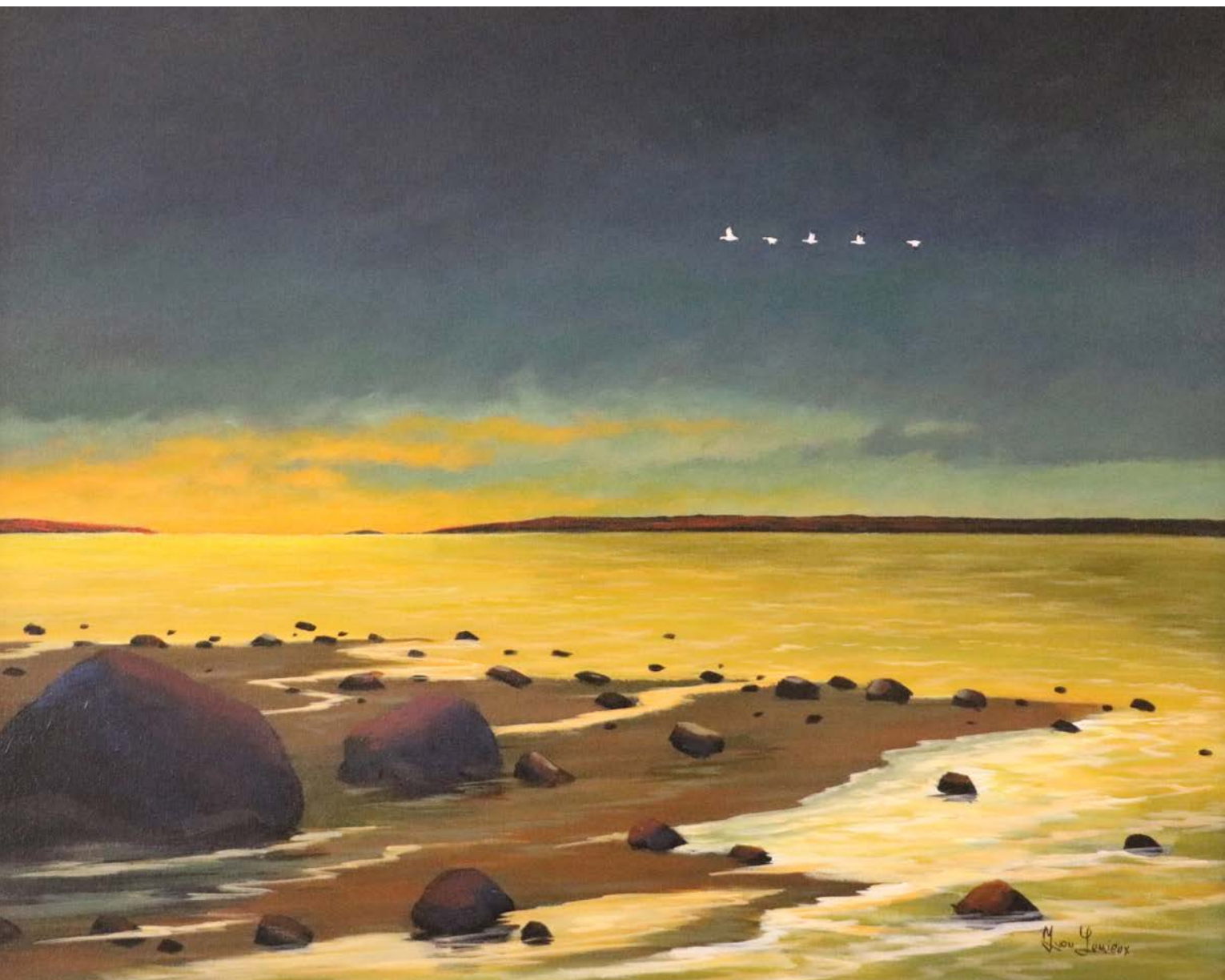
Marée basse, huile sur toile, 20 x 24 po

Les paysages québécois d'Yvon sont de véritables études sur la beauté, illustrant son grand amour de la nature. Il se dégage une réelle lueur de ses paysages. L'utilisation de subtiles valeurs et nuances, la fluidité de la perspective, la brillance de l'huile intensifient la profondeur de sa vision. L'artiste est aussi un habile sculpteur sur bois, dégagant du noble matériau non seulement les formes mais la personnalité même de ses sujets.