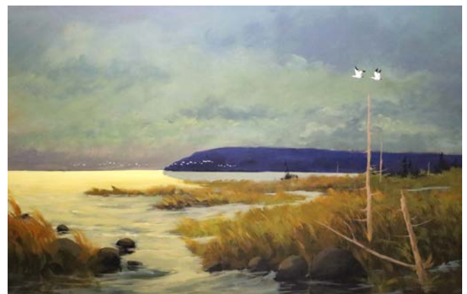
Les deux solitaires, huile sur toile, 24 x 36 po