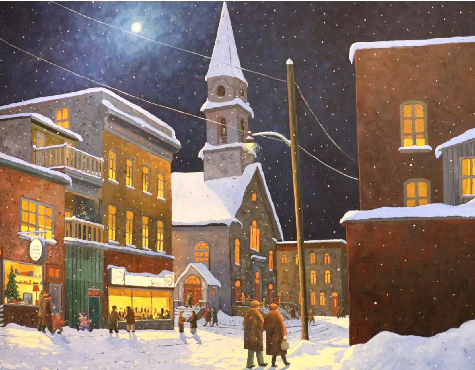
Vieux Québec, huile sur toile, 48 x 60 po