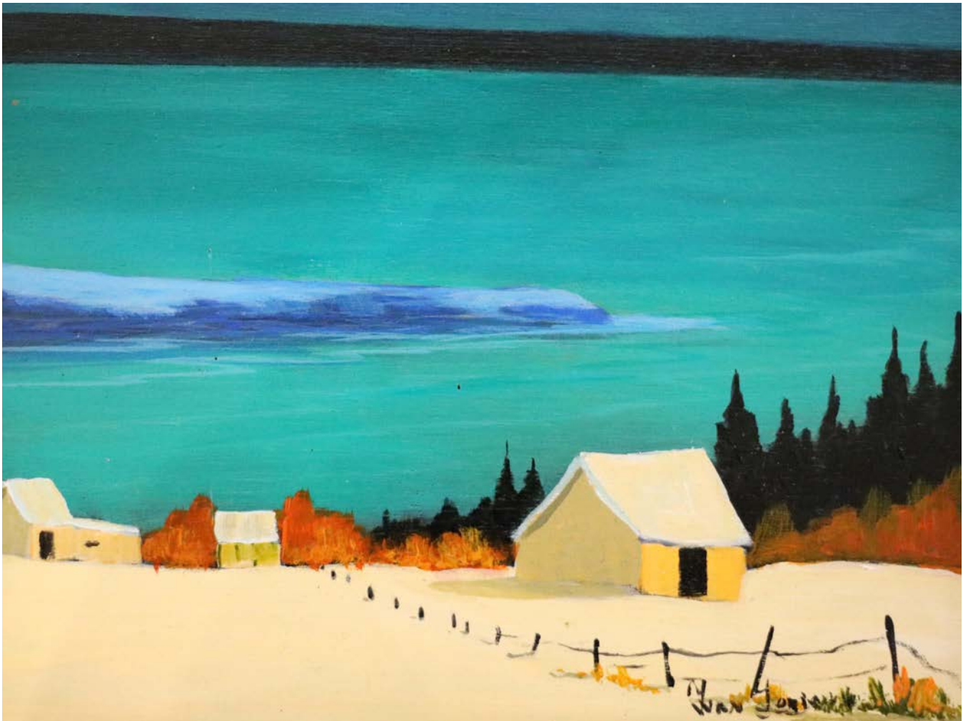
Untitled, Oil on Board, 8 x 6 in