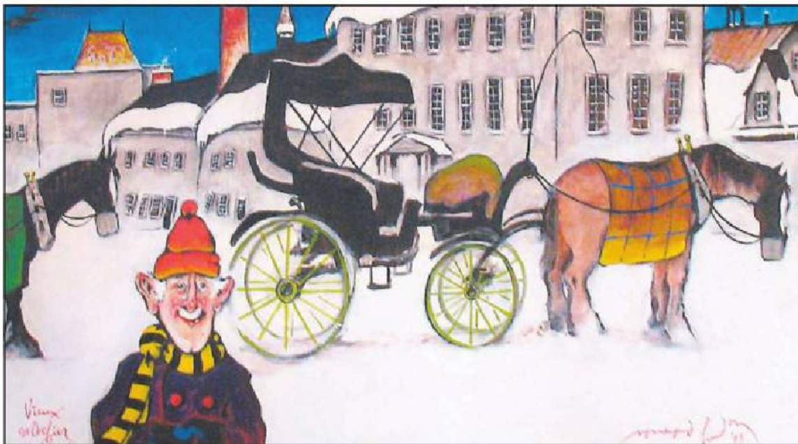
Le vieux caléquier québécois.

G.N. Normand Hudon a marqué l'univers de la caricature et de la peinture dans les années 40 à 90. La galerie d'art Le Castelet de Saint-Sauveur présente l'exposition «Un demi-siècle dans la vie de Normand Hudon» jusqu'au 3 avril.