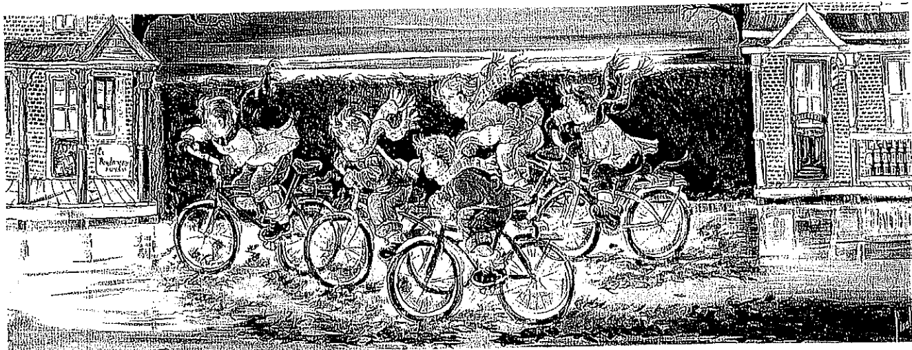
« La course folle », huile sur toile, 20 x 48 po.