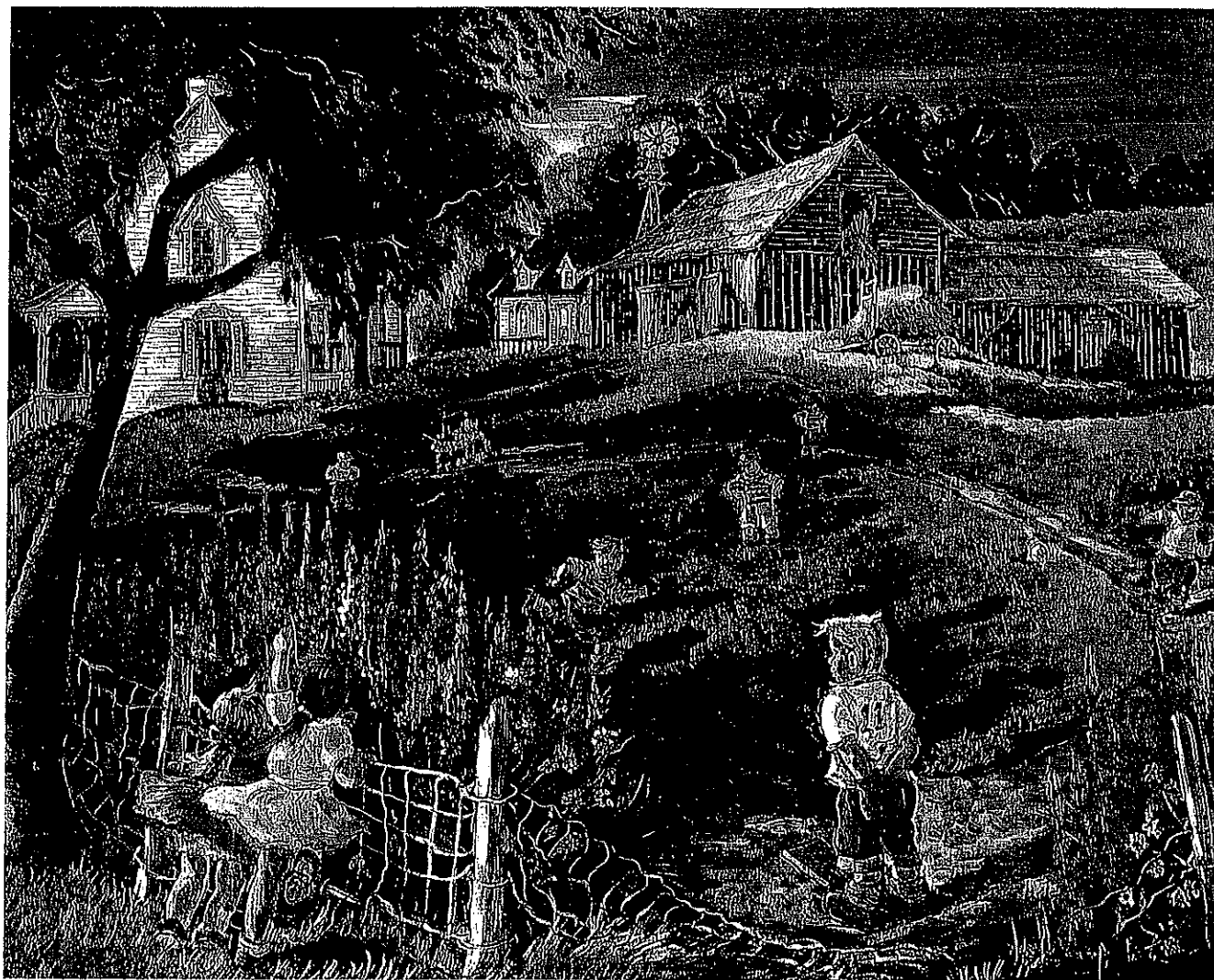
« Partie de campagne » huile sur toile, 16 x 20 po.

O n se demande parfois si on doit révéler l'existence de personnes et de lieux qui sont comme des bijoux cachés dans un écrin. Mais je ne sais pas garder un secret.