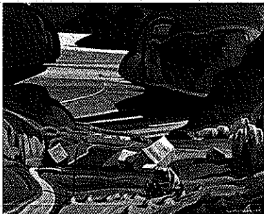
Anse aux Roches Saguenay Qc.