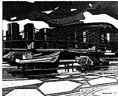
Port de Longueuil Qc.