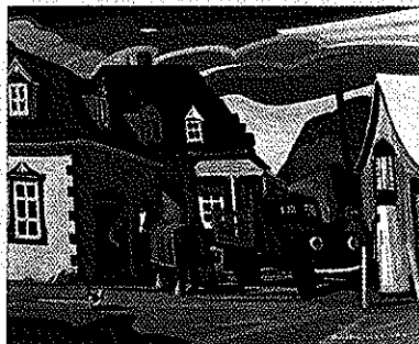
« Forge le temps d'une paix » Qc.