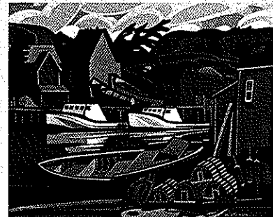
Herring's Cove N.É.