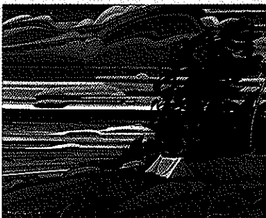
Lac Huron Ont.