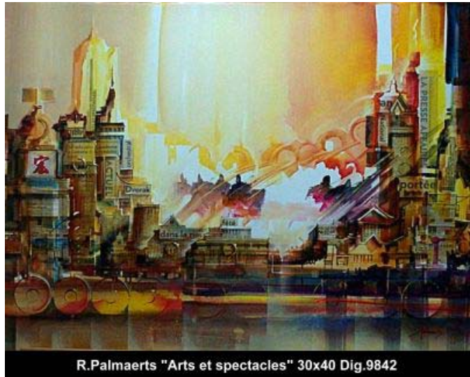
R.Palmaerts "Arts et spectacles" 30x40 Dig.9842

Bruxelles est la capitale de la Belgique moderne et un chef-lieu de la Communauté européenne tandis que Reims, historiquement, fut la métropole de la Confédération de Gaule du Nord... en plus, naturellement, d'être reconnue mondialement pour ses champagnes.