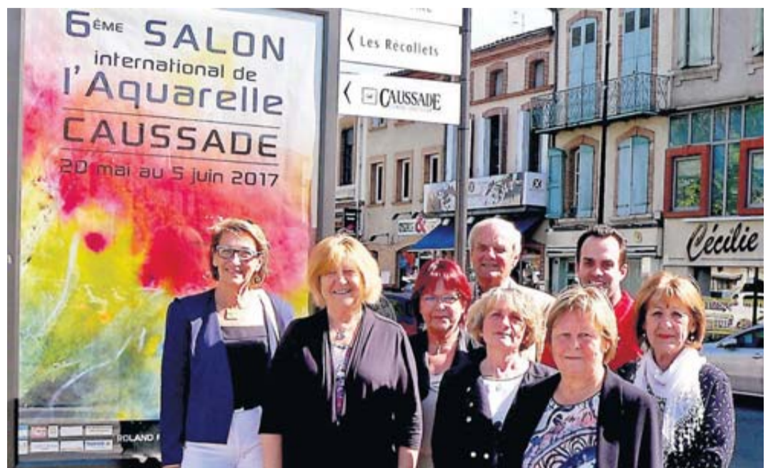
Les bénévoles de l'association Aquarelle-en-Quercy organisatrice du salon.