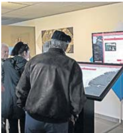
La Mounière propose un espace scénographique très riche en histoire.

Tarifs: Plein tarif: 3 €. Tarif réduit: étudiants, retraités, demandeurs d'emploi, enfants de moins de 12 ans: 2 €. Groupes: groupes sans accompagnement (à partir de 10 pers.) 2 € et tarif sur demande pour un accompagnement. Gratuit pour les moins de 6 ans. Site internet: www.septfonds-la-mouniere.com , courriel: lamouniere@septfonds.fr , renseignements à la mairie au 05 64 90 27.