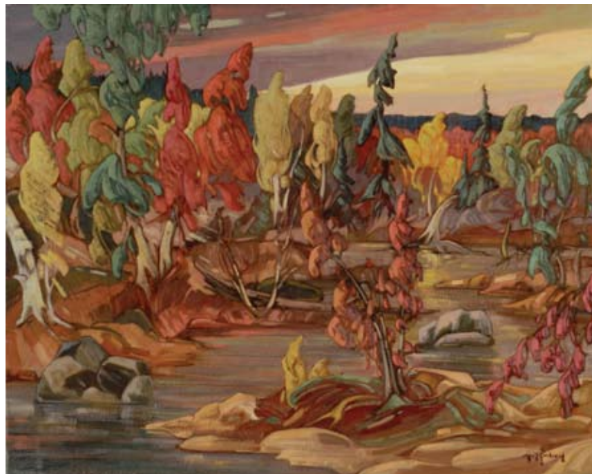
Au cœur de l'action, huile, 61 x 76 cm