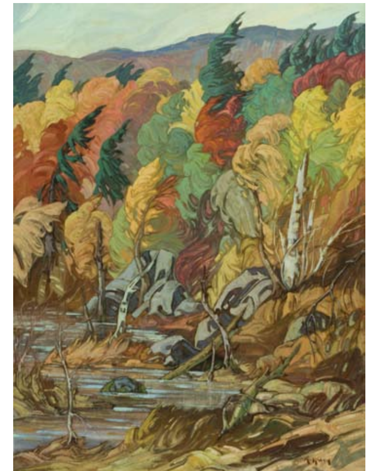
Symphonie le vent, huile, 101cm x 76 cm