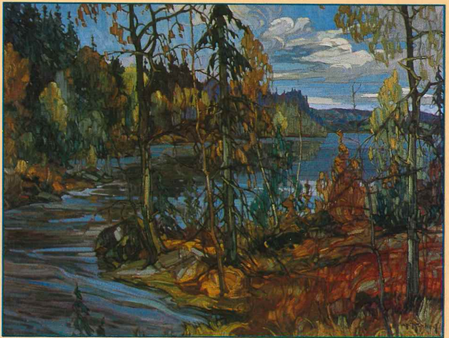
Été indien en Mauricie