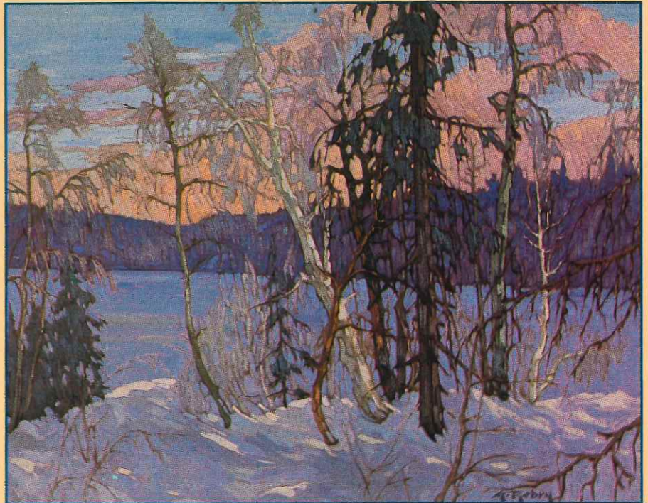
Rosé du soir

«Chaque tableau que je fais me prend 30 ans, puisque c'est le résultat de ce que j'ai peint depuis mes débuts, de réussi ou de raté, d'audacieux ou d'hésitant.» En effet, sans tous les tableaux précédents, celui que Gaston Reby brosse aujourd'hui serait impossible; et, sans ce dernier, tous les précédents n'auraient pas le même sens, la même raison d'exister. Son oeuvre se déroule comme une chaîne où chaque tableau constitue un chaînon, comme un film où se succèdent des centaines de fragments qui se tiennent pour former un tout, un peu comme chacun des centimètres carrés de chaque toile.